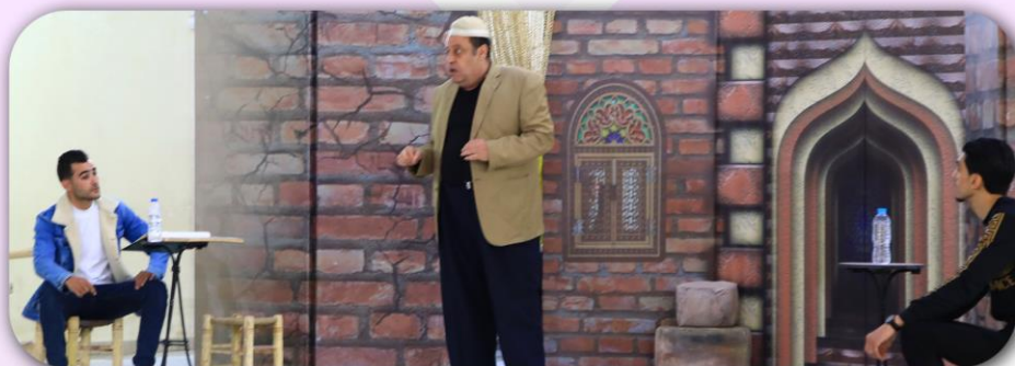
صور من عروض مسرحية "مغامرة رأس المملوك جابر"